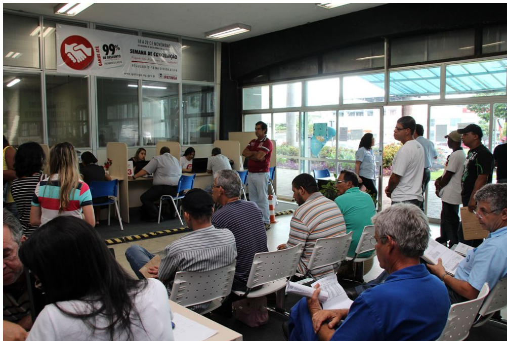
Um grande número de contribuintes compareceu ao atendimento da Prefeitura, na manhã desta sexta-feira.

Contribuintes aderem em peso à programação que concede desconto de 99% em juros e multas para o pagamento à vista de débitos na dívida ativa